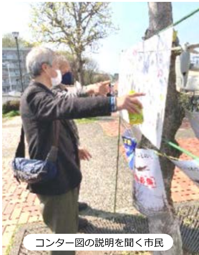
コンター図の説明を聞く市民

昭島支部の独自の取り組みとして、コンター内を宣伝カーによる原告への参加呼びかけを連日行いました。