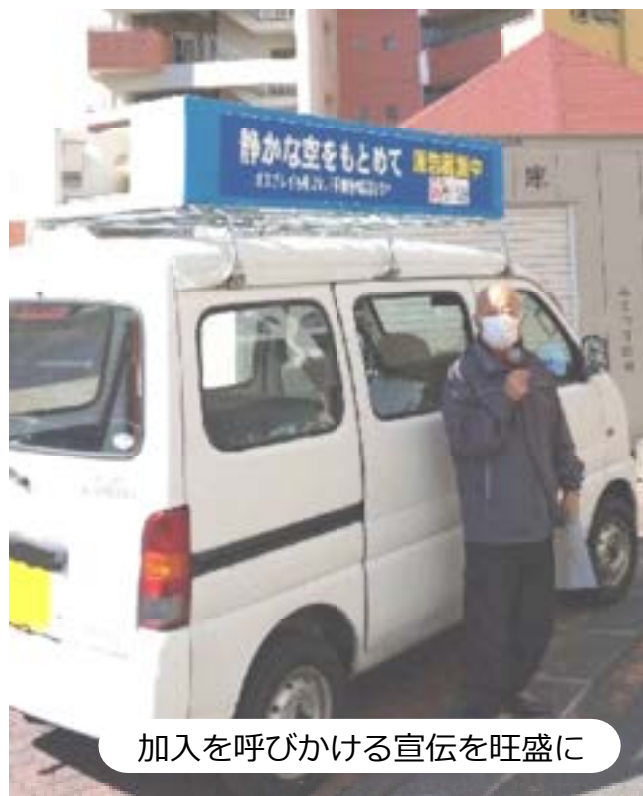
加入を呼びかける宣伝を旺盛に